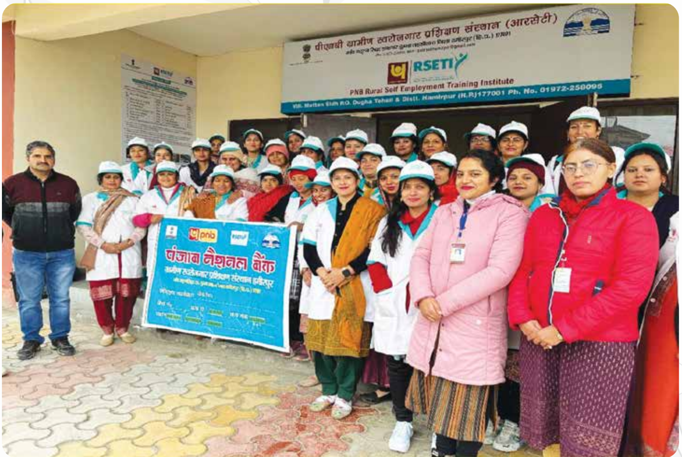
आरसेटी, हमीरपुर में प्रशिक्षण कार्यक्रम Training Program at RSETI, Hamirpur

Impact of RSETIs in Self-Employment: Since inception 4,74,977 people got self-employed after getting training from these institutions. Total expenditure done during review year (April 2024- March 2025) was Rs.6767.34 Lakhs.