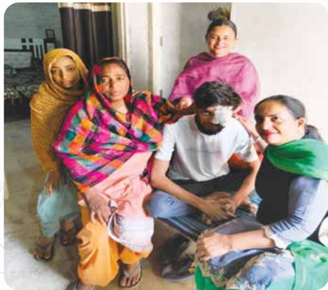
एनजीओ कैंसरपोर्ट कैंसर रोगियों के घर जाकर उन्हें चिकित्सा सहायता प्रदान करता है NGO CanSupport providing therapy to cancer patients by visiting their homes