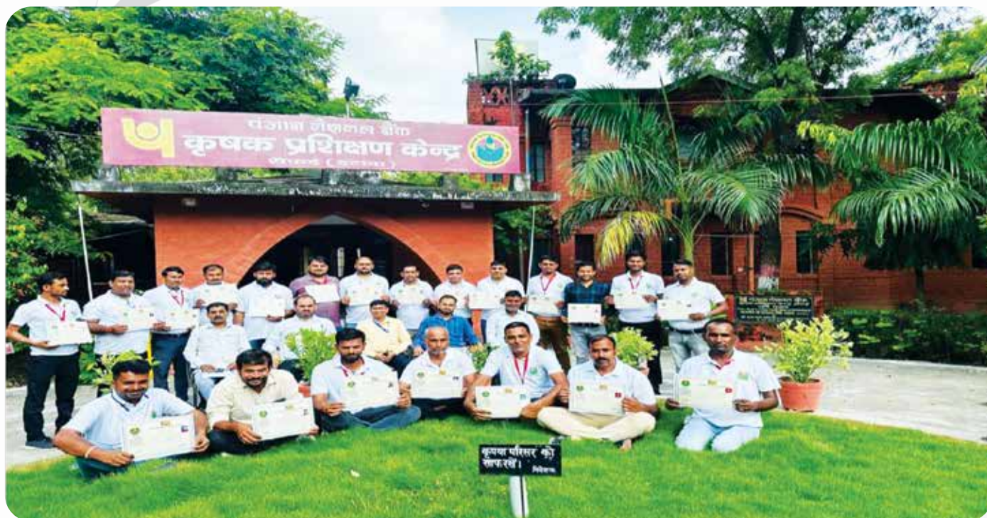
वित्तीय प्रशिक्षण केंद्र, इटावा में प्रशिक्षण कार्यक्रम Training Program at Financial Training Centre, Etawah