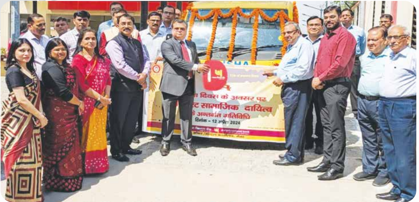
अंचल कार्यालय, मेरठ द्वारा कॉर्पोरेट सामाजिक उत्तरदायित्व के अंतर्गत “दिशा – विशेष बच्चों के लिए स्कूल” को एक स्कूल बस भेंट की गई। Zonal Office, Meerut presenting a school bus to “Disha – School for Special Children” under Corporate Social Responsibility