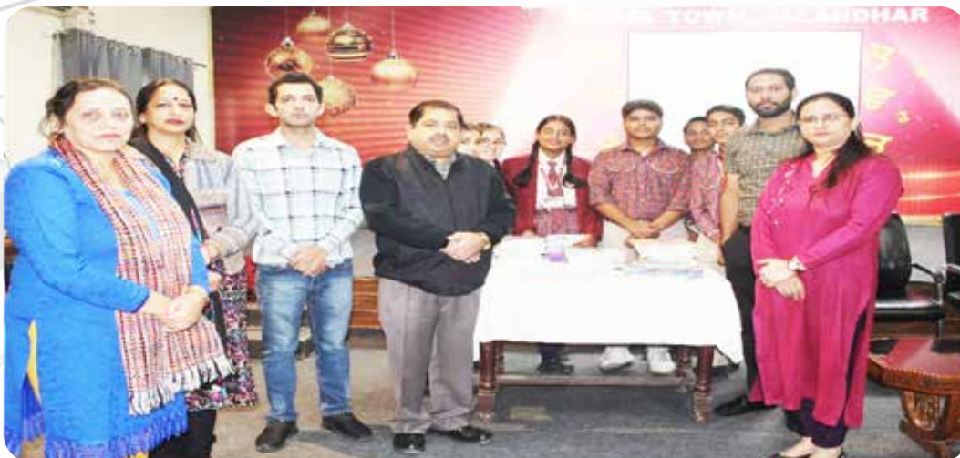
पीएनबी द्वारा दयानंद मॉडल स्कूल जालंधर में जरूरतमंद छात्रों को पुस्तकों एवं स्टेशनरी का वितरण।

Distribution of Books and Stationery Items to needy students at Dayanand Model School Jalandhar by PNB