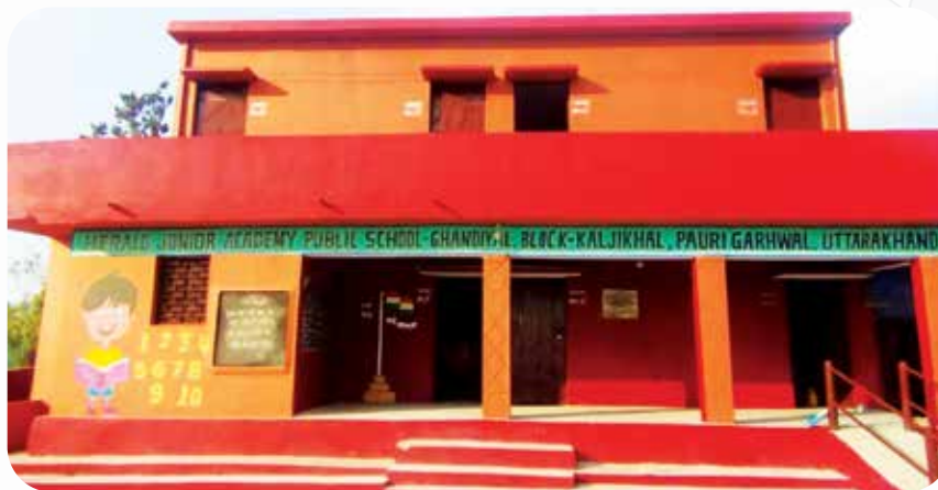
उत्तराखंड के हेराल्ड जूनियर पब्लिक स्कूल को आधारभूत ढांचे के विकास के लिए सीएसआर सहायता CSR to Herald Junior Public School, Uttarakhand for infrastructure development

PNB intends to be a catalyst for change that benefits present and future generations. Sustainability is an integral part of PNB's activities – in our core business and beyond. Thus, we believe in being responsible to all our stakeholders, society and the environment.