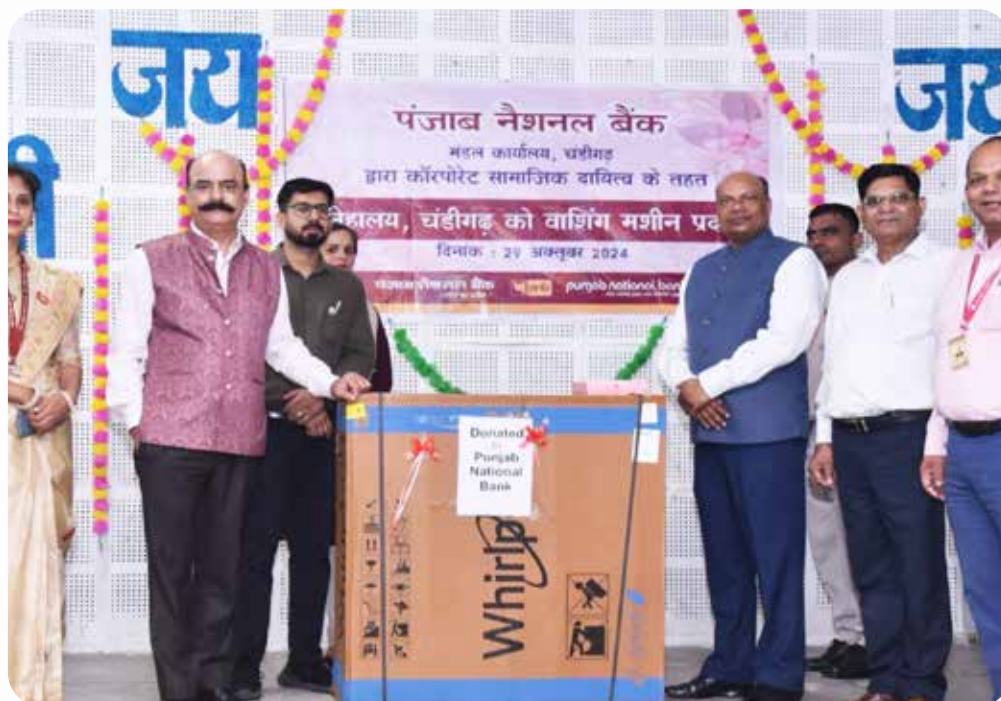
पीएनबी चंडीगढ़ द्वारा बैंक की कॉर्पोरेट सामाजिक उत्तरदायित्व के अंतर्गत स्थानीय अनाथाश्रम को वाशिंग मशीन का वितरण। Distribution of Washing Machine to local orphanage by PNB Chandigarh as part of the bank's Corporate Social Responsibility.